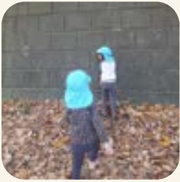
だるまさんがころんだ！