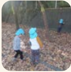
楽しそう！ いーねーてー