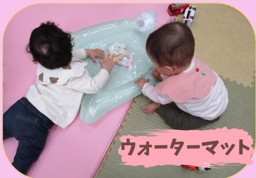
ウォーターマット