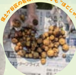
/こんなにとれたよ～！